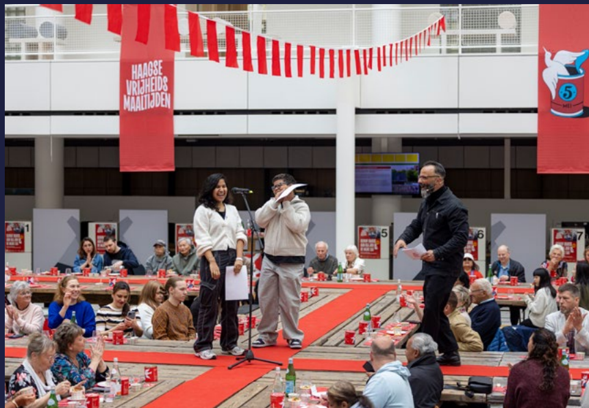
Vrijheidsmaaltijd van de Stad