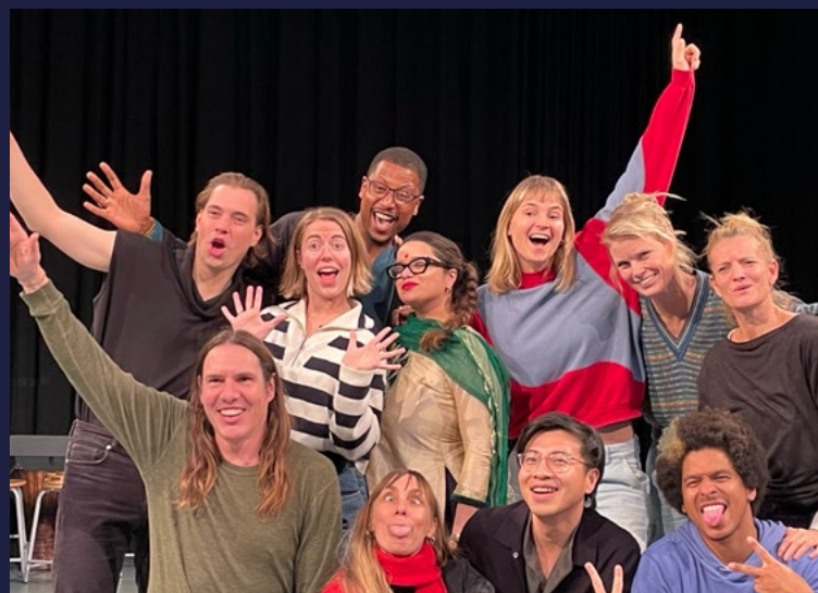
docententeam Speak up! Haganum