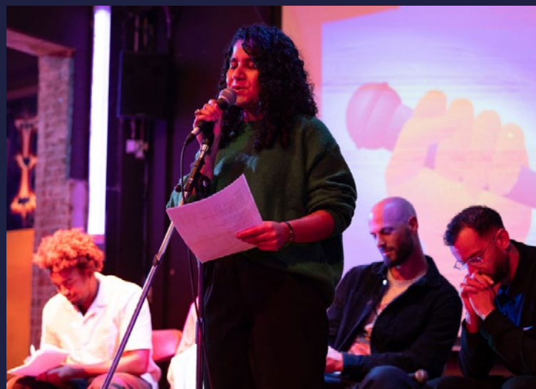
Pass the Mic