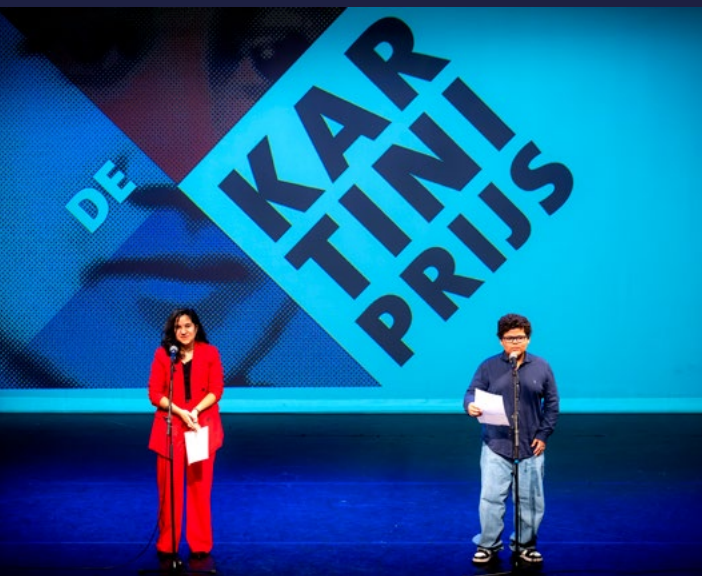
Kartiniprijs – Vrouwendagen