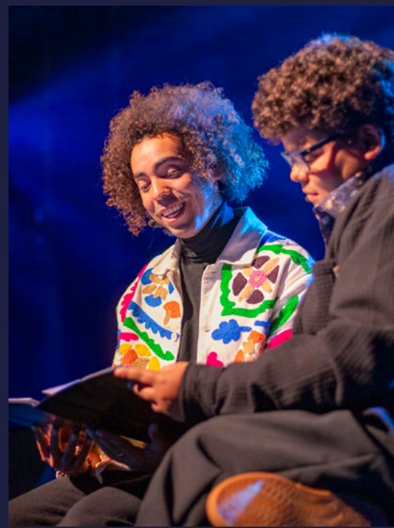
4 mei Kinderherdenking 70 jaar UNICEF