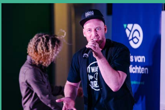
Notes, Beats & Bars